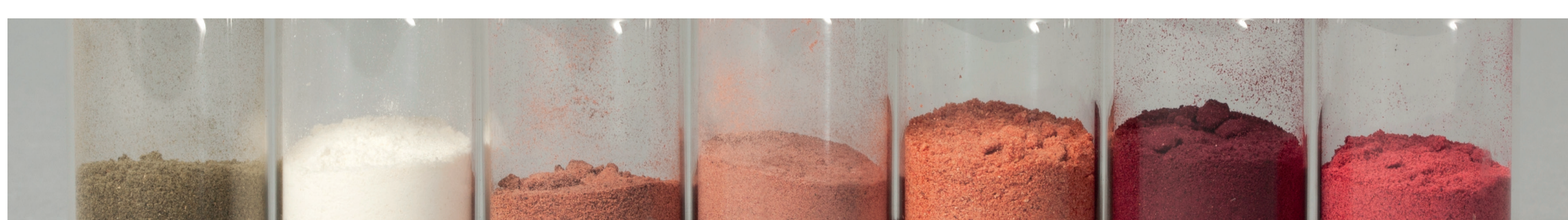
Ramsløg plantedele hæmmer Salmonella forskelligt i bouillon model. Data fra Flemming Hansen, DMRI (Teknologisk Institut, Roskilde)