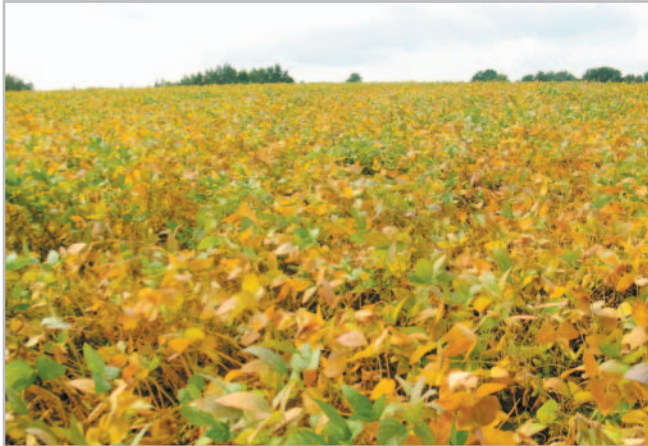
Porosty biosóji v různých stadiích vegetace