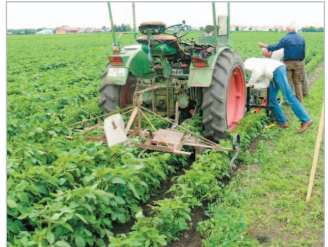
Čtyřřádková plečka v porostu sóji

Sklizeň samotného porostu provádíme v co nejnižší výšce, abychom dokázali sklídit i nejnižší nasazené lusky. Zde oceníme jarní urovnání povrchu. Též je vhodné pro sklizeň využít sklízecí mlátičku s užším žacíím ústrojím. Musíme dávat dobrý pozor na kontaminaci sójových bobů půdou. Takto znečištěné bobky jsou vhodné pouze ke krmným účelům, a tím do-