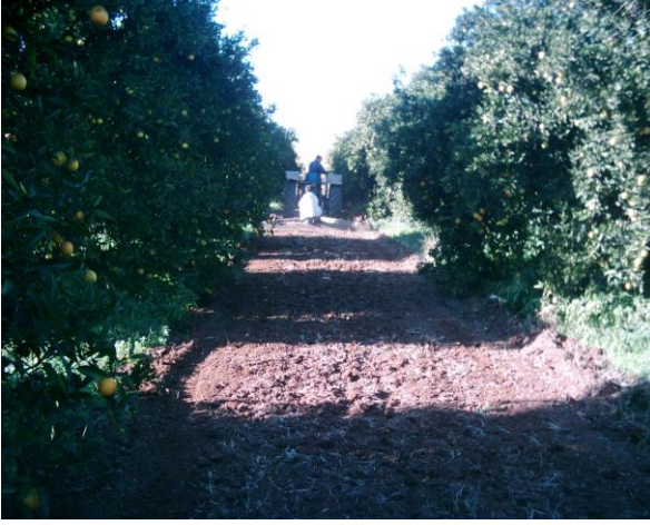
Alata Bahçe Kùltürleri Arařtırma Enstitüsü (Erdemli)'nde deneme parsellerinden bir görüntü