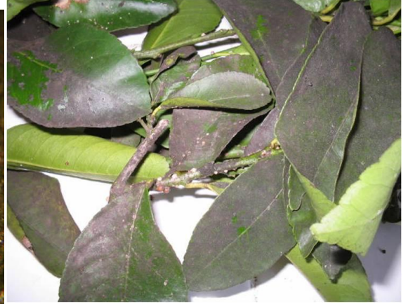
Yıldız Koşnili'nin yaprak üzerinde oluşturduğu fumajin