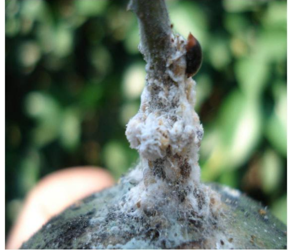
Meyve sapında Turunçgil Unlubiti ve predatör Cryptolaemus montrouzieri