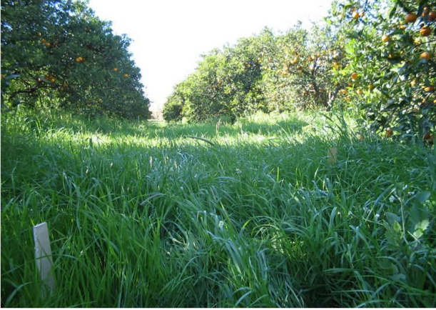
Örtücü bitki olarak Lolium italicum (Çim, “Caramba”) parseli