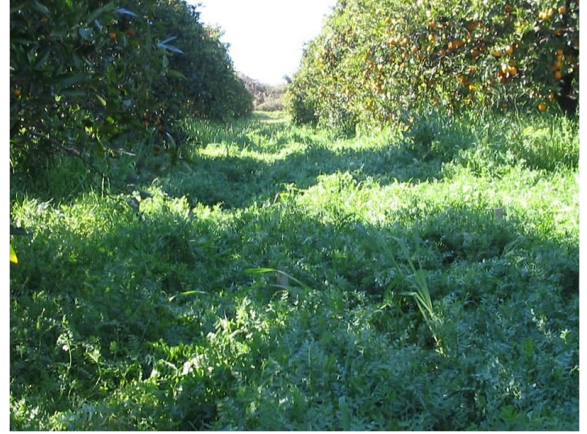
Örtücü bitki olarak Trifolium resupinatum (Üçgül, “Demet”) parseli