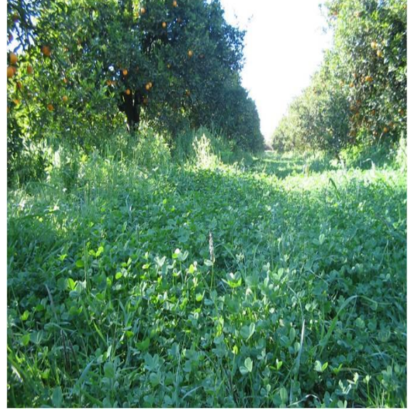
Örtücü bitki olarak Vicia sativa (Fiğ, “Kubilay”) parseli