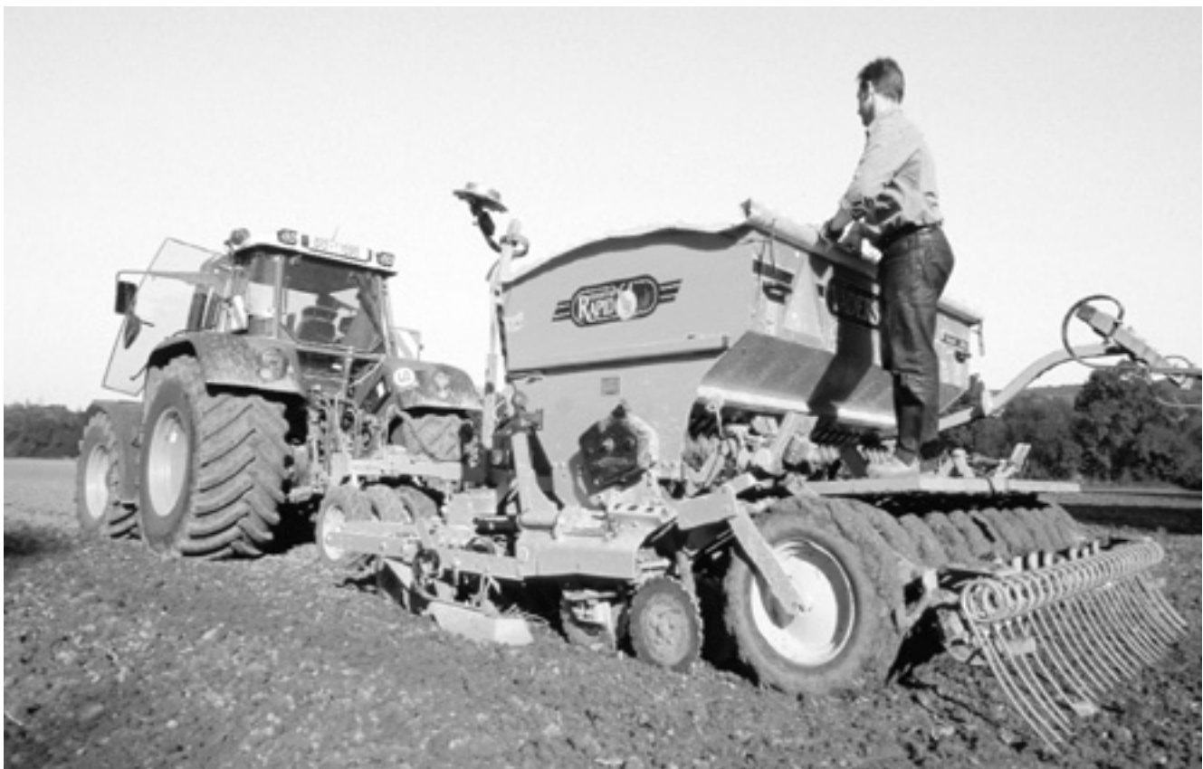
■ Gut für Boden und Energiebilanz: Die Direktsaatmaschine kann auch im ungepflügten Acker säen.