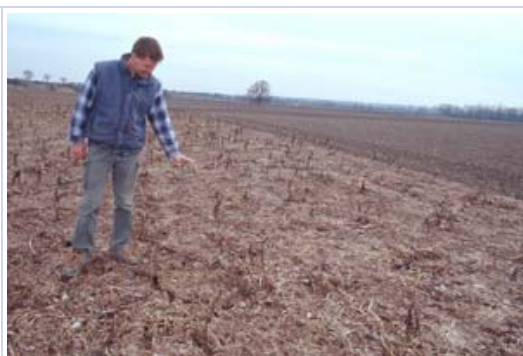
Abb.3: Abgefrorener Zwischenfruchtbestand im Frühjahr. Der Landwirt zeigt, wie hoch die Zwischenfrüchte gewesen waren

Die Kostenfrage ist nur ein Aspekt des Zwischenfruchtanbaus. Sind z. B. bereits als Hauptfrüchte Leguminosen oder Kreuzblütler vorgesehen, sollten diese nicht auch noch als Zwischenfrüchte angebaut werden, um Fruchtfolgekrankheiten zu vermeiden. Ebenso ist zu beachten, ob eine frühe Saat möglich ist, ob Unkrautunterdrückung durch frühe Jugendentwicklung gefördert wird und ob im Frühjahr die Zwischenfrüchte abfrieren und so eine Mulchsaat möglich wird (Abb.3).