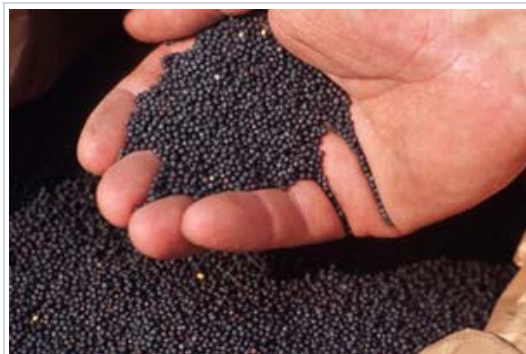
Abb. 1: Winterrapsaatgut