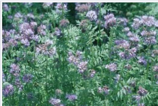
Abb.2: Zwischenfrucht Phacelia