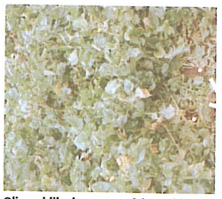
Olieræddike har meget dybe rødder og kan opsamle kvælstof fra 2,5 meters dybde.

som vinterraps og gul sennep samt kurveblomsten cikorie, er sandsynligvis også gode til at hente nitrat op fra dybe jordlag. Generelt gælder, at en god etablering ved såning senest 15. august giver mulighed for en tæt plantebestand med stor evne til nitratopsamling.