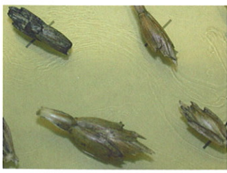
Måske er speltens avner med til at beskytte mod dannelse af OTA.

Man ved fra både danske og udenlandske undersøgelser, at forekomsten af Fusarium -toksinet deoxynivalenol (DON) varierer meget fra sort til sort. En svensk undersøgelse tyder på en tilsvarende sortsvariation i OTA-produktion i både byg og hvede, men spørgsmålet er ikke særligt grundigt undersøgt, slet ikke for rug og spelt.