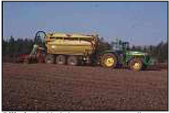
Billede 1. Med de meget store gyllevogne der anvendes, er der meget stor risiko for uoprettelige strukturskader. Det gælder især ved nedfældning.

83 kr/ton konventionel svinegylle! Hertil skal så lægges udbringningsomkostninger. Det