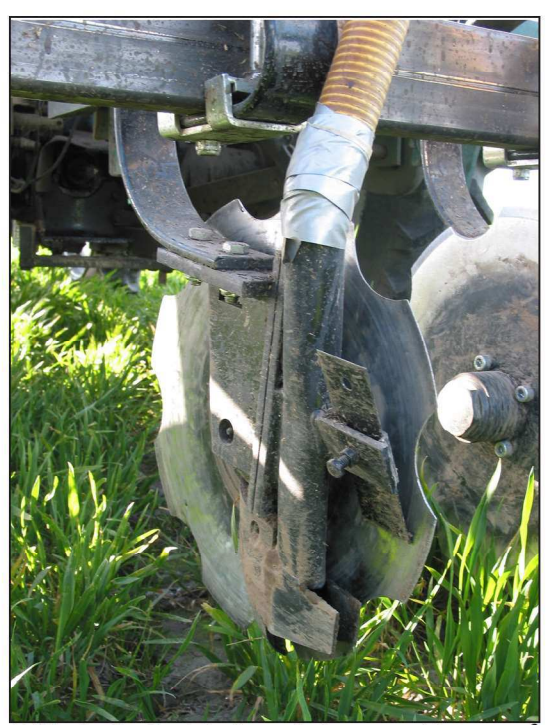
Billede 2. Gødskning af vintersæd kan også ske ved nedfældning. Vintersædens optagelse af kvælstof øges - til gengæld laves der større afgrødeskade.

Det optimale gødskningsniveau for vinterhvede og vinterrug er lavere i 2010 end i 2009 (se tabel 6). Forklaringen på denne forskel kan dels skyldes forskel i vejret. Varmt vejr omkring kernefyldning har stor betydning for høstudbytterne. Forskelle mellem jordtyper på forsøgsarealernes har også stor betydning for, hvor stort høstudbyttet kan blive.