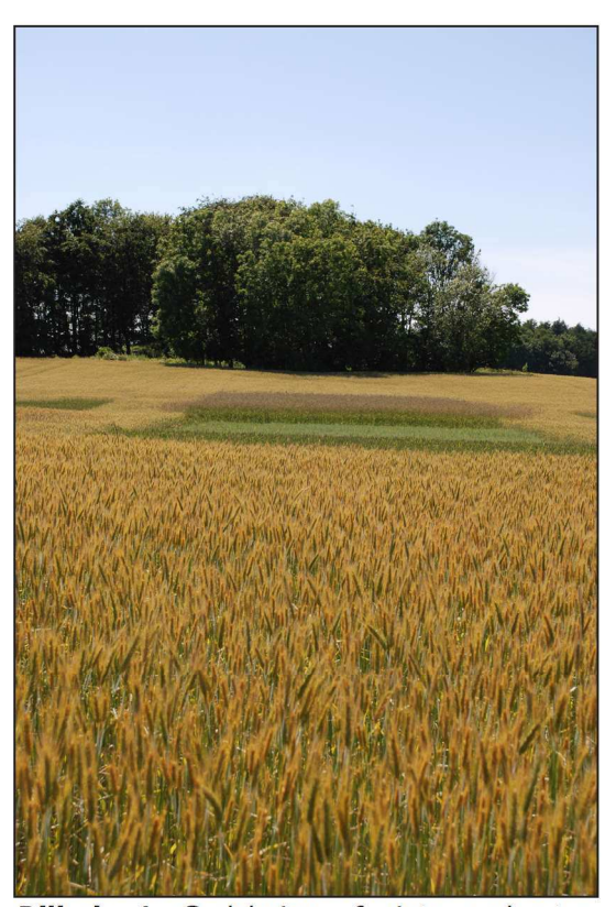
Billede 1. Gødskning af vintersædsarter. Forrest vintertriticale.

Merudbyttet i vinterhvede viste en stigende tendens med øget gødskning i forhold til ugødet. Udbyttetigningen ophørte ved gødningsniveauer over 150 kg N/ha. Udbyttet på 68 hkg/ha ved tildeling af 200 kg N/ha var lavere end forventet. Juni 2010 var kold og fugtig og dette kan være forklaringen på manglende kernefyldning i toppen af akset. Normalt øges udbyttet i vinterhvede hvis