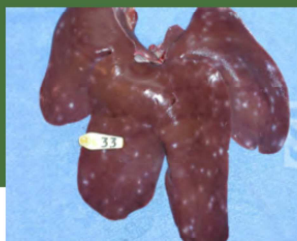
Lever med ormepletter