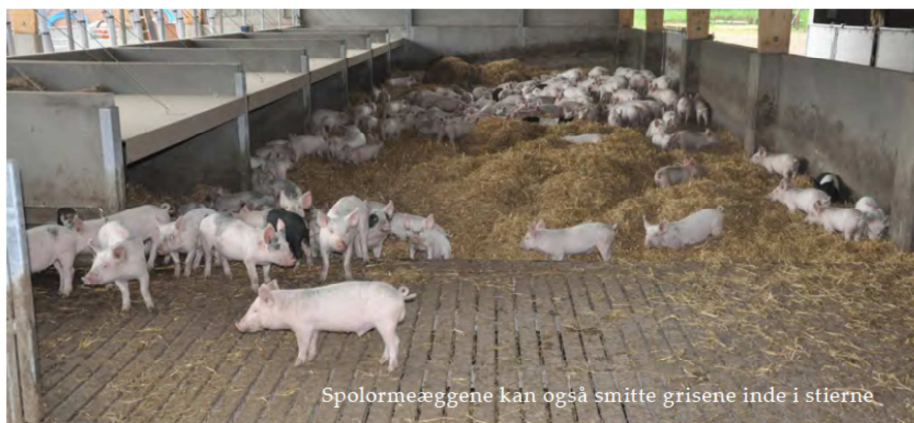
Spolormeæggen kan også smitte grisene inde i stierne

Spolormen er uden tvivl godt tilpasset grisen og dens levevis. Selv i SPF besætninger kan parasitten være svær at kontrollere. PAROL projektet har dog hjulpet med at skabe en bedre sammenhæng med tidligere viden. Sammenligningen af forskellige besætninger har også været med til at kortlægge, hvor grisene smittes og hvor der stadig er udfordringer at tage hul på, for at kunne forbedre rådgivningen ude i besætningerne.