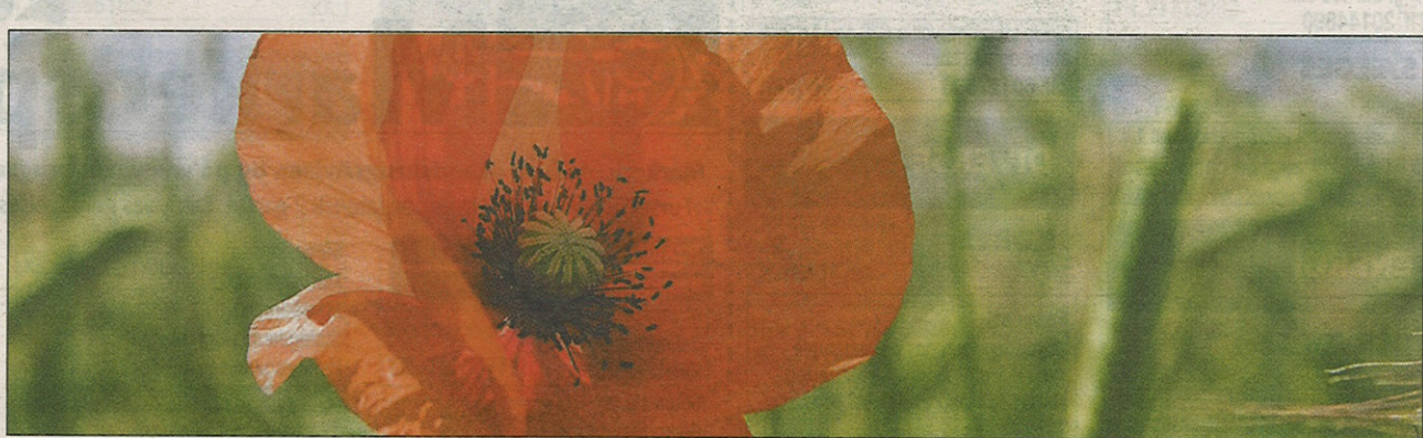
Analyser viser, at sundhed spiller en stor rolle i forhold til, hvor meget man er villig til at betale for økologiske varer.

Omlægning af kløvergræs og såning af majs kan nu ses som et af de nyeste videoindslag på den elektroniske dagbog fra FØJO's markforsøg. Dagbogen findes på www.okologgen.dk og er et supplement til den traditionelle formidling af forskningsresultater. Ideen med okologgen er, at forskere og teknikere tager fotos eller video undervejs igennem hele forsøgarbejdet. Billeder og videoklip lægges derefter ud på loggen og forsynes med små tekster som giver en praktisk beskrivelse af arbejdet. Det kan f.eks. være i forbindelse med udvikling af nye redskaber, nye sædskifter eller nye måder at bekæmpe ukrudt på. Interesserede som landmænd, konsulenter og studerende kan så ved selvsyn følge med i forsøgsarbejdet på internettet. Kilde: www.okologgen.dk