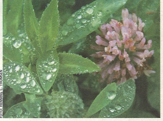
gødning Slæt i kløvergræsset fjernes og bruges som gødning