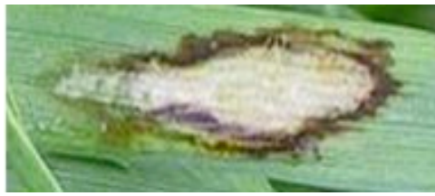
Foto 1. Skoldplet (forårsaget af Rhynchosporium secalis ).