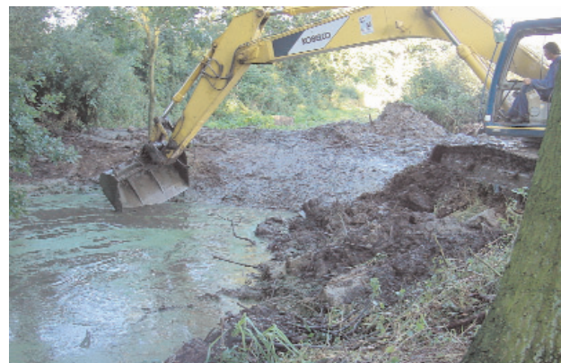
Abb. 7: Ausbaggern einer „Kuhle“ (Eiszeitrelikt) auf der Liegenschaft Trenthorst im Sommer 2001

ten und den Gewässerausbau wider. Der vertiefte Kenntnisstand über die Ökologie dieser Arten erlaubt eine gezielte Förderung und Nutzung für den ökologischen Landbau. Untersucht werden soll, ob die Umstellung auf ökologischen Landbau die Arten- und Individuenarmut der Liegenschaft wieder umkehren kann. Erforscht wird, welche Bedingungen dafür erforderlich sind und wie diese sich im betrieblichen Ablauf und auf das Ergebnis auswirken. Die Landschaftsstruktur und die Säume sind dabei von besonderem Interesse ( Abb. 7 ).