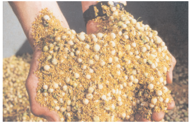
Abb. 6: Erntegut des gemeinsamen Mischbaus von Erbsen und Leindotter vor der Trennung

Besonders bodenbrütende Vogelarten sind durch die mechanische Kulturpflege (striegeln, walzen und mulchen) beeinflusst, aber auch saum- und knickbewohnende Vogelarten