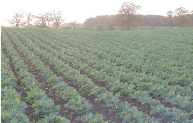
Abb. 4: Anbauverfahren von Winterraps in ökologischem Anbau, Hackkultur in weiter Reihe, Trenthorst 10/2001