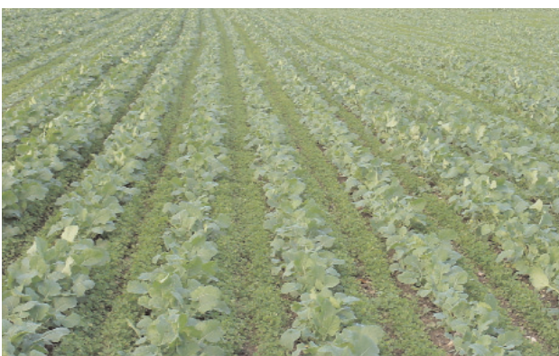
Abb. 5: Anbauverfahren von Winterraps in ökologischem Anbau, Mulchkultur mit Kleeuntersaat in weiter Reihe, Trenthorst 10/2001