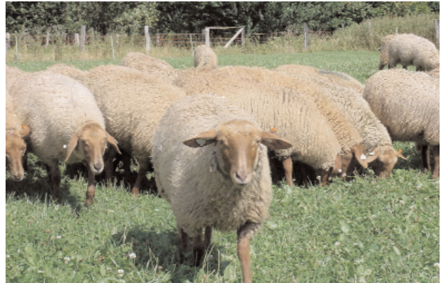
Abb. 1: Schafe der Rasse Coburger Fuchse

Anlässlich der Neuinstallierung der Tierhaltung in Trenthorst sollte ein Überblick zum endoparasitologischen Status der Schaf- und Ziegenlämmer gewonnen werden, die im Sommer und Herbst des Jahres 2001 von langjährig ökologisch wirtschaftenden Betrieben aus ganz Deutschland zugekauft wurden. Es kamen 300 kleine Wiederkäuer zur Aufstallung, die sämtlich aus der Frühjahrslammlung 2001 stammen. Dabei handelt es sich um die Rassen Bentheimer Landschaf (aus zwei Betrieben), Coburger Fuchsschaf, Rhönschaf, Merinolandschaf, Schwarzköpfiges Fleischschaf, Schwarzes Milchschaft (aus zwei Betrieben) und Bunte Deutsche Edel-