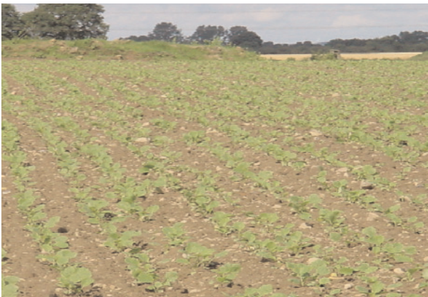
Abb. 3: Anbauverfahren von Winterraps in ökologischem Anbau, Normalsaat, Trenthorst 10/2001

Die Daten dienen weiterhin als Grundlage für die Bewirtschaftung der Flächen und sind Forschungsgrundlage für weitere Fragestellungen, wie der