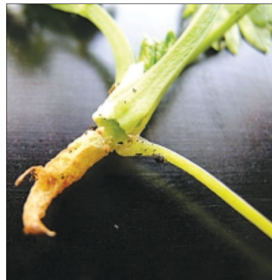
Abb. 1. Adulte Mücken sind oft an Blättern und Spross zu finden (links). Die Larven der Trauermücken fressen Pilzfäden und sich abbauende organische Substanz. Pflanzenwurzeln schädigen sie vor allem auf der Suche nach Wasser. Gemeinsam mit Pilzen verursachen sie allerdings verstärkten Schaden (rechts).

Fig. 1. Les adultes des sciarides habitent sur les feuilles et la pousse (à gauche). Les larves des sciarides dévorent les hyphes des champignons et la matière organique en décomposition. Elles provoquent des dégâts aux racines des plantes surtout pour satisfaire leurs besoins en eau. C'est en synergie avec les champignons qu'elles causent toutefois les dégâts les plus importants (à droite).