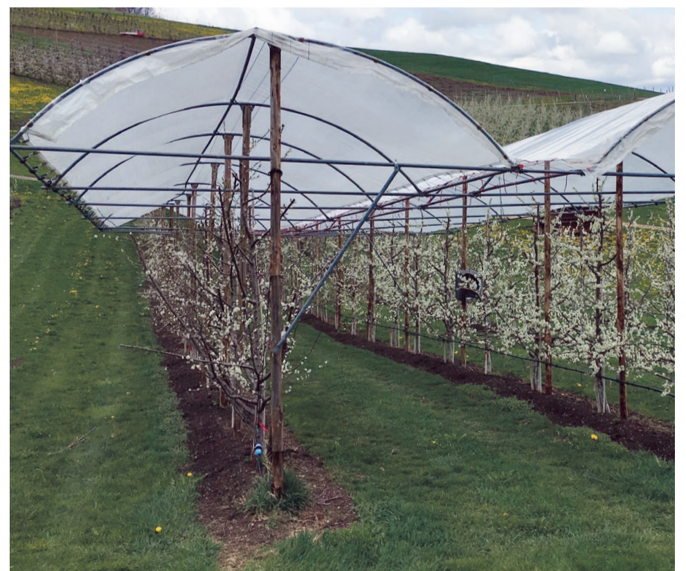
Abb 5: Zwetschgenanbau unter Witterungsschutz.