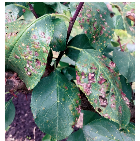
Abb. 4: Befall mit Pseudomonas.