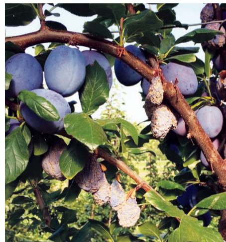
Abb. 3: Befall mit Fruchtmonilia.