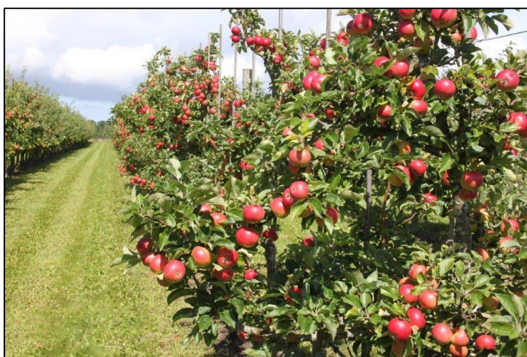
Billede 1. Økologisk æbleplantage på Sydsjælland. Frugt og grøntsager er den produktkategori indenfor økologiske fødevarer, der oplever størst vækst på detailmarkedet i øjeblikket

Provinsen følger i hovedstadsområdets fodspor og har haft en stigning i økologiske spisemærker på 24% i forhold til 2016.