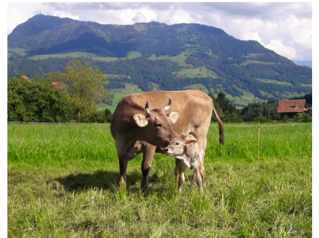
Original Braunvieh-Kuh mit ihrem Kalb auf der Weide. Die Mastkälber werden auf anderen Biobetrieben gemästet.