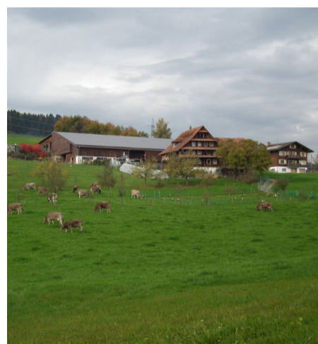
Betrieb der Familie Appert in Udligenswil, LU