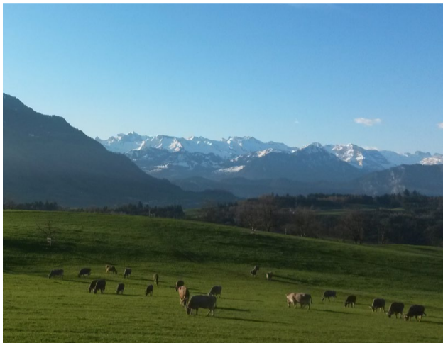
Voralpine Hügelzone ...