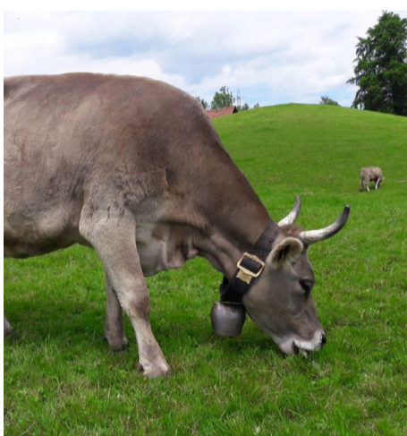
Die Rasse OB eignet sich gut für die effiziente Produktion von Milch und Fleisch auf der Weide, besonders im Hügel- und im Berggebiet