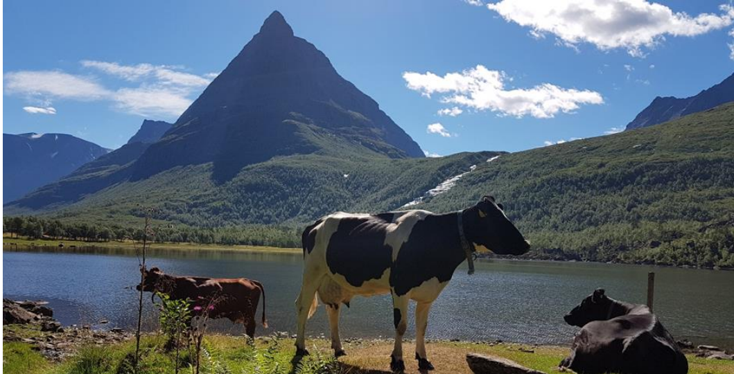
Storfe på utmark i Innerdalen i Sunndal kommune