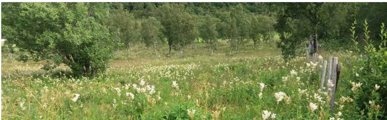
Snart er det bare restene av det gamle gjerdet som avslører at dette området engang ble brukt til beiting.