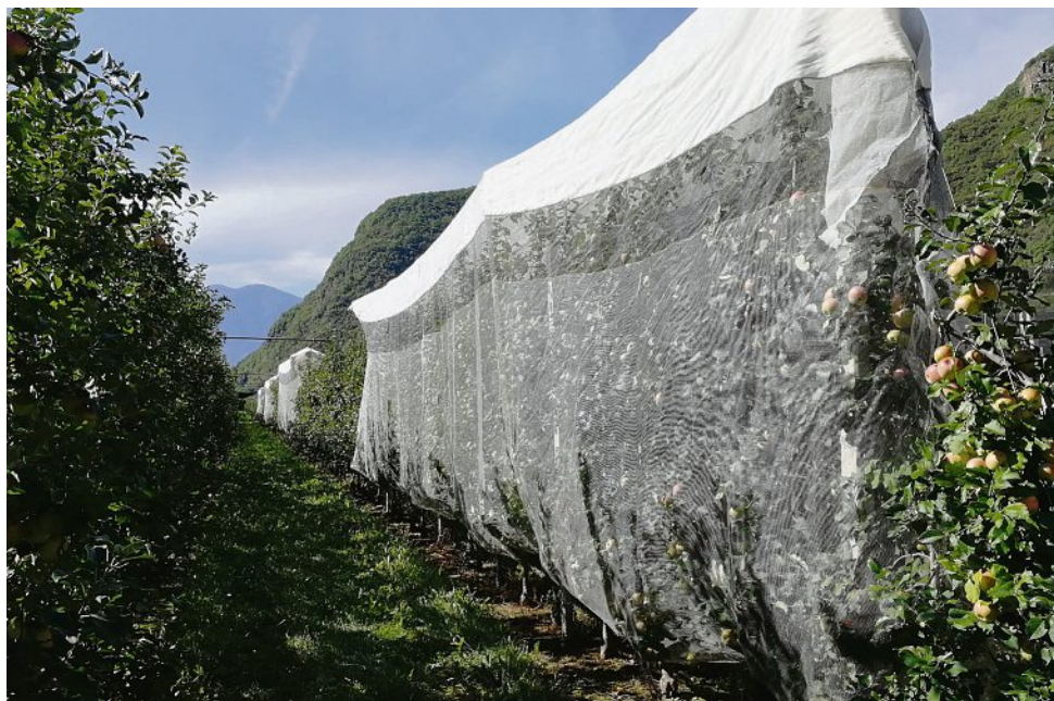
Abb. 1: Eine durch das Keep-in-Touch®-System geschützte Fuji-Anlage (rechts) und die Kontrollanlage (links) am Versuchszentrum Laimburg

Zunächst machen die Forschungseinrichtungen lokal erhältliche Produkte ausfindig. Im Idealfall sind dies abfallende Produkte aus der landwirtschaftlichen oder industriellen Produktion, deren Stickstoffgehalt und deren Potenzial, dem Boden Nährstoffe (u. a. Stickstoff) zuzuführen, bewertet wird. Am Versuchszentrum Laimburg sind derzeit zwölf