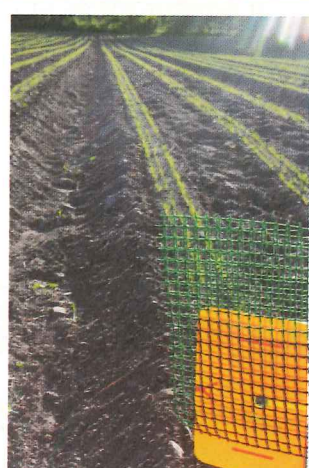
Foregangsfylket for økologiske grønnsaker og potet har tilrettelagt for markdager, demonstrasjoner og rådgiving rundt om i landet.

utviklet et nettbasert kartverktøy for hele landet, hvor økologiske produsenter med ulike produksjoner kan «finne» hverandre, forteller Kari Mette.