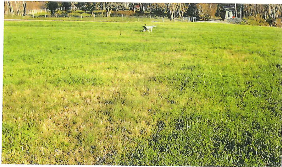
Flekker: Ved flekkvis dårlig vekst i enga bør en undersøke om det skyldes nematoder eller sopp.

Wekstskifte og god hygiene er viktig når skade har oppstått. Bruk av andre engbelgvekster enn rødkløver kan bidra til å dempe skadeomfanget, f.eks. blåtunge og hvitkløver. God høstpløying kan være aktuelt mot frittlevende