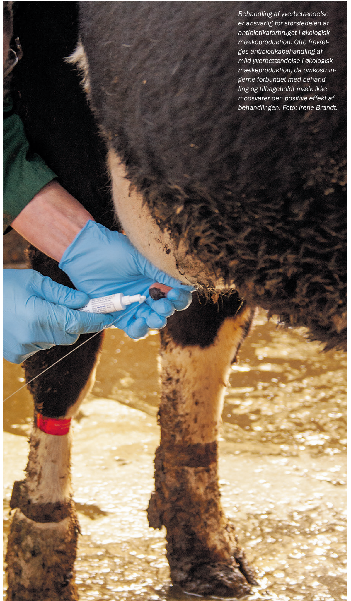
Behandling af yverbetændelse er ansvarlig for størstedelen af antibiotikaforbruget i økologisk mælkeproduktion. Ofte fravælges antibiotikabehandling af mild yverbetændelse i økologisk mælkeproduktion, da omkostningerne forbundet med behandling og tilbageholdt mælk ikke modsvarer den positive effekt af behandlingen.

Fem økologiske malkekvægsbesætninger (131-200 årskøer) deltog i projektet. I alle besætninger foregik malkningen med robotter. 70 køer med forhøjet celletal (SCC > 400.000) indgik i forsøget. Køerne var mellem 70 og 548 dage efter kælvning ved forsøgsstart. De blev tilfældigt fordelt på to forsøgsbehandlinger, således at 34 af køerne fik afgoldet en kirtel, mens de øvrige 36 fungerede som kontrolkøer og blev malket på alle kirtler. Kirtlen, der blev afgoldet, blev udvalgt vha.