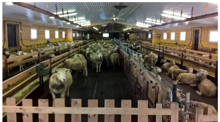
Bilde 1 og 2: Dagens løsning.