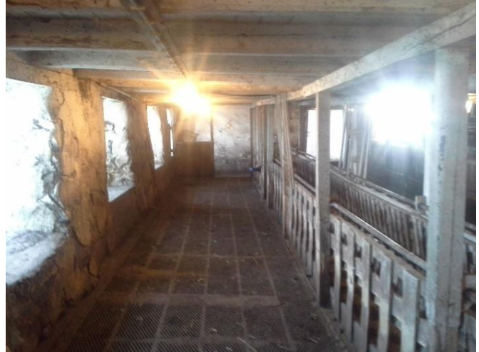
Bilde 3 og 4: Bilder av dagens løsning. Til venstre er den midtre delen av fjøset og til høyre er den eldste delen.