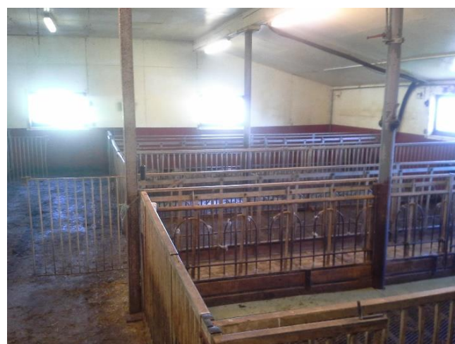
Bilde 1 og 2: Bilder av dagens løsning. Dette er fra den nyere delen av fjøset.