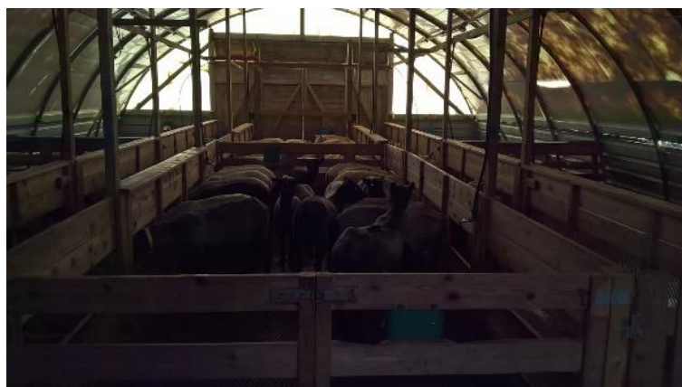
Bilde 1 og 2: Bilde av dagens løsning.