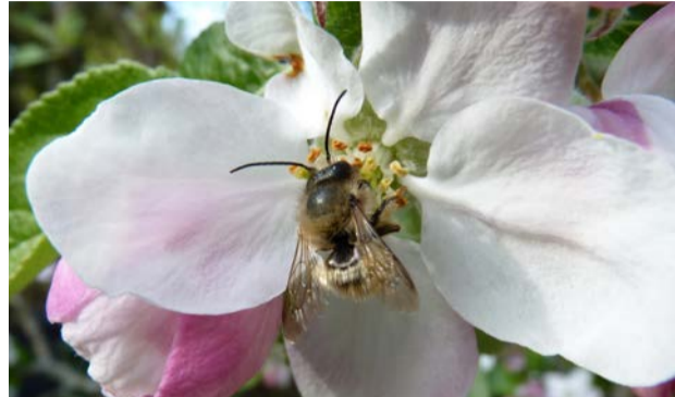
Wildbiene an Apfelblüte