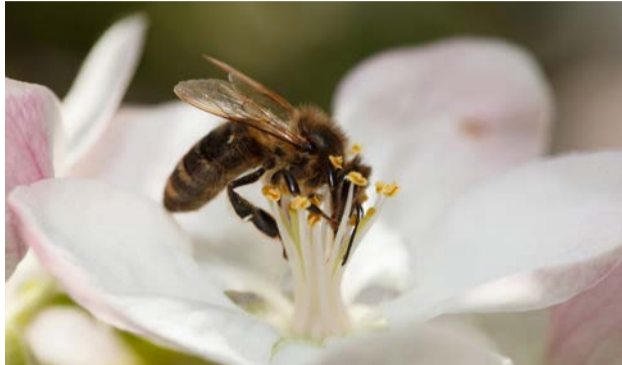
Honigbiene an Apfelblüte