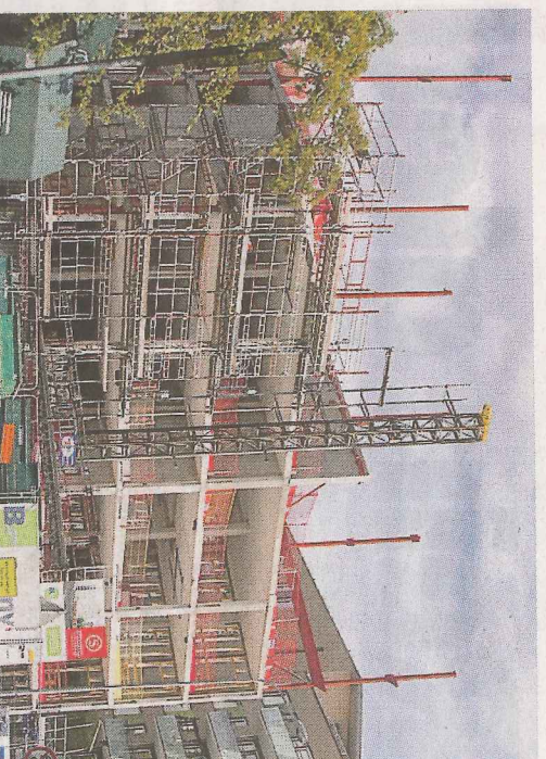
Studentboliger: Vi bygger studentboliger for utlendinger, mens de norske må ut på markedet, skriver innsenderen.