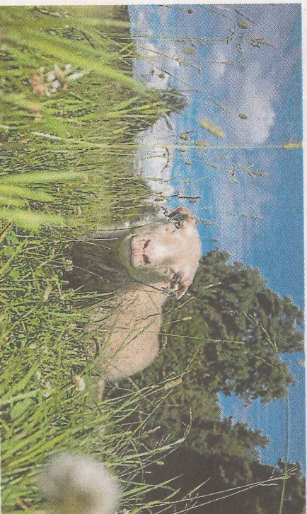
Homeopati: Vår erfaring er at homeopatiske og fytotherapeutiske midler ikke er mer brukt i økologisk enn i konvensjonelt landbruk, skriver innsenderen.

Dette er et vanskelig punkt. Metodetrvikling for forskning på alternativer til skolemedisinen ble derfor løfta fram på innspillkonferansen til EU-kommisjonen om økologisk landbruk i fjor. Alternativer behandlingsmater har en helt annen historie og et annet fotfeste i mange andre land. Homeopati er godkjent som medisinsk alternativ gjennom lov i flere europeiske land. Ved mange utdannings- og forskingsinstitusjoner pågår det arbeid om hvor-