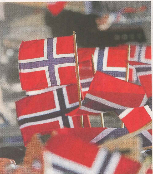
Verdier: EØS-avtalen er et angrep på de frihetsverdiene vi burde hegne om, og som vi minnes om hver eneste 17. mai, skriver innsenderen.

Schengen-avtalen EØS-avtalen åpner grensene for utlendinger som strømmer til Norge i tusenvis, og tvinger oss til å godta vedtak tatt over hodene våre som deler av norsk lovgivning. EØS-avtalen er et angrep på de frihetsverdiene vi burde hegne om, og som vi minnes om hver eneste 17. mai