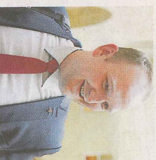
Statsråd: Regjeringa, representert ved landbruks- og matminister Jon Georg Dale.