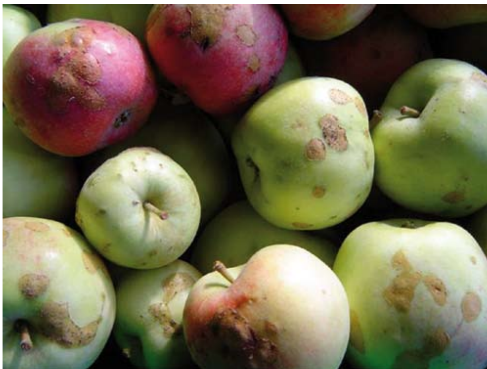
Skade av teger i eple.

Ei anna viktig gruppe av skadedyr er teger. Dei skader ved å stikke munn delen inn i epla, suge ut saft og sprøyte inn eit stoff som fører til «stein» og «kork» i epla. Det er få tiltak mot denne gruppa. Det å halde undervegetasjonen nede er eit tiltak mot nokre av artane. Å fjerne alternative vertsplanter som ligg nær frukthagen (til dømes selje, hassel, bjørk, brennnesle, bringebær) kan vere eit tiltak mot mellom anna hageteger. Dei viktigaste skadetegelegg egg sine i fruktgreinene. God skjering og opne tre kan redusere skaden.