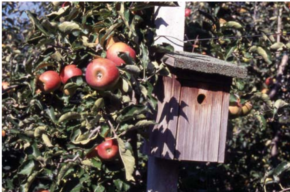
Fuglekassar som førebyggjande tiltak mot skadedyr.

Mange av larvene som høyrer til gruppane målarar, nattfly og viklarar, som et på bladverk og på utsida av epla, kan gjere stor skade. Fugl er eit viktig nyttedyr mot slike larver (sjå avsnittet om førebyggjande plantevern).