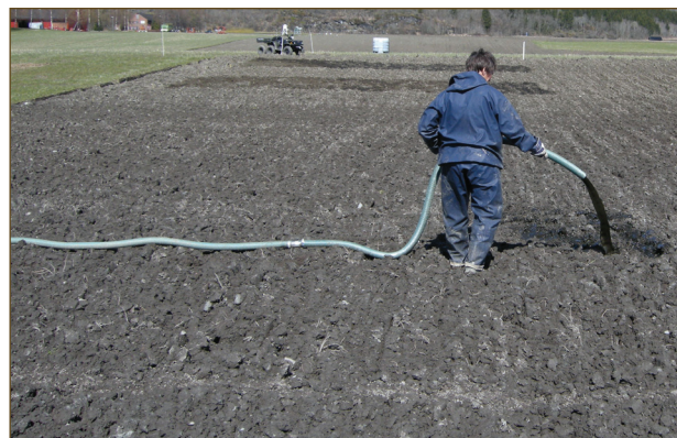
Halve arealet der den overjordiske grønnmassen ble fjernet i 2009, ble våren 2010 gjødslet med biorest fra fermentert plantemasse tilsvarende 11 kg totalnitrogen per dekar.