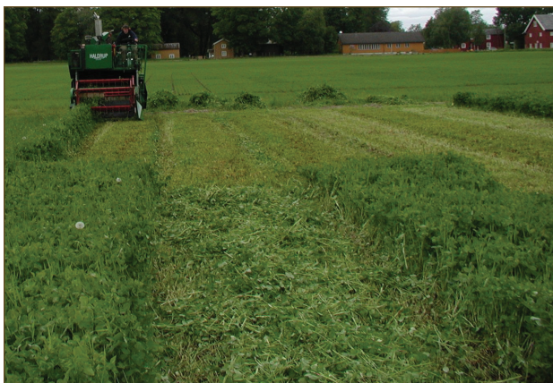
Grønn gjødselenga ble slått tre ganger. Grønnmassen ble enten liggende på stubben for å råtne eller ble fjernet.