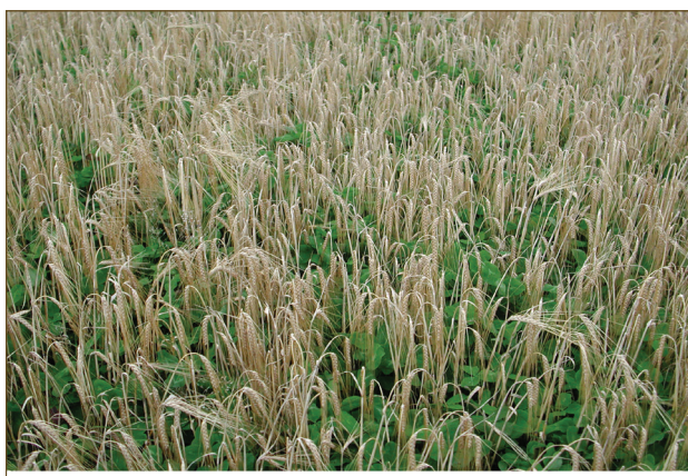
I 2008 var det ugjødslet bygg (Sunnita) med undersådd grønn gjødsel på feltene. Her er det like før tresking på Apelsvoll. Kornavlingene var 194, 262, 240 og 202 kg tørrstoff per dekar for henholdsvis Kvithamar, Værnes, Apelsvoll og Ås.

Ved biogassfermentering dannes metan og ammonium ved at lett nedbrytbart organisk materiale i gjødsla omdannes anaerobt. Metanet (biogass) kan benyttes til produksjon av varme, elektrisk strøm eller til drivstoff. Bioresten er lettflytende, kan spres om våren når kornet har mest behov for næring og inneholder ammonium som er lett tilgjengelig for plantene. Men hva skjer med meitemarken når mye av maten blir tatt bort enten ved at den overjordiske grønnmassen blir helt fjernet, eller det lett nedbrytbart organisk materiale er tatt ut av bioresten?