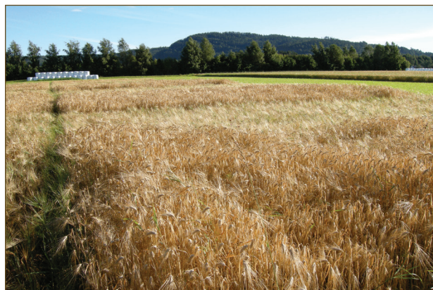
Her er bygget treskeklart på Værnes.