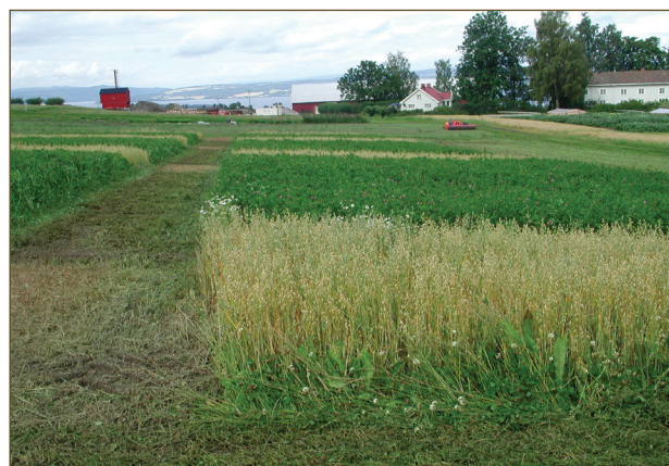
I 2009 fikk grønn gjødselenga ulik behandling. For å kunne sammenligne med jord uten grønn gjødsel ble det dyrket havre (Gere) uten gjødsel. Grønn gjødselenga bestod av rødkløver, timotei, engsvingel og flerårig raigras.

Fire feltforsøk ble gjennomført i perioden 2008-2011. To av feltene lå i Midt-Norge, på siltig mellomleire på Kvithamar og siltig sand på Værnes. Et felt var på lett-leire ved Apelsvoll på Toten og ett på mellomleire på Ås.