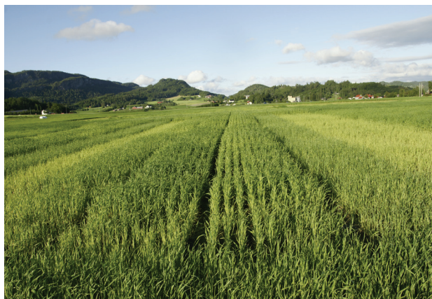
Utover sommeren ble det stor forskjeller i hvordan bygget vokste og trivdes. Her fra Kvithamar 10. juli 2010.