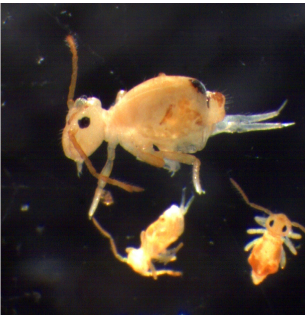
Figur 3. Flest spretthaler er mest aktive om våren og ettersommeren, men denne arten ( Dicyrtoma minuta ) er mest aktiv om sommeren. Den todelte hoppegaffelen sees på den største og en av de minste spretthalene.

formering i ekstremhabitater som havstrender og forurenset jord. Eggene legges ofte i klaser i hulrom eller under steiner. Flere hunner kan bruke samme stedet og det kan være flere tusen på ett sted. Utviklingen av eggene avhenger av temperaturen. Under kontrollerte forhold klekkes egg fra samme art etter 25 dager ved 9 °C, mens de klekkes etter bare 7 dager ved 20 °C. Ungene som klekkes fra