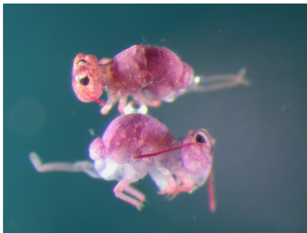
Figur 1. Vi kan dele spretthaler inn i to hovedgrupper etter utseende. Entomobryomorpha, kalt leddspretthaler, har en langstrakt og tydelig leddet kropp. Den andre gruppen, Symphyleona, kalles kulesporetthaler og likner på små kaniner i fasongen. Det som ser ut som en lang hale på dyra, er hoppegaffelen.

Kjønnset og ukjønnset formering er vanlig hos spretthaler. Ukjønnset formering skjer ved at ubefruktede egg fra hunner utvikles til nye individer (partenogenese). Generelt formerer små jordlevende arter seg ukjønnset i stabile, forutsigbare omgivelser. Mens arter som lever på overflaten og arter som lever i mer ustabile miljøer formerer seg kjønnset. Noen arter «velger» formeringsmåte etter omgivelsene. Eksempelvis formerer den vanlige Mesaphorura macrochaeta seg ukjønnset i stabile og forutsigbare miljøer, mens den velger kjønnset