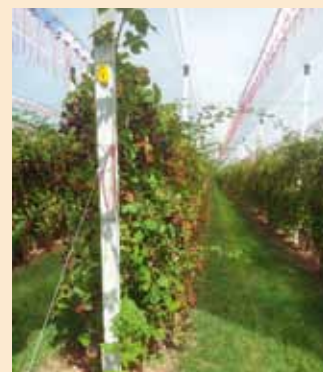
Overkapping van braam op Fruitweelde