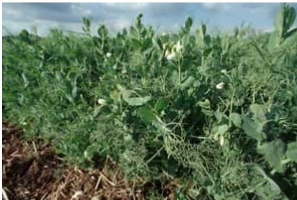
Erbsen können bereits im März oder April - früher als beispielsweise Bohnen - ausgesät werden, denn sie vertragen auch leichte Fröste.

Sobald sich das erste Laubblatt entfaltet, kann keimendes Unkraut mit dem Striegel reguliert werden. Weitere Durchgänge sind bei Bedarf bis zum Schließen der Reihen durch die Ranken möglich. Wichtig ist, den Striegeldruck an das Entwicklungsstadium der Pflanzen anzupassen. Gegebenenfalls kann auch zwei Mal hintereinander gestriegelt werden, um bei geringem Zinkendruck dennoch eine gute Wirkung zu erzielen.