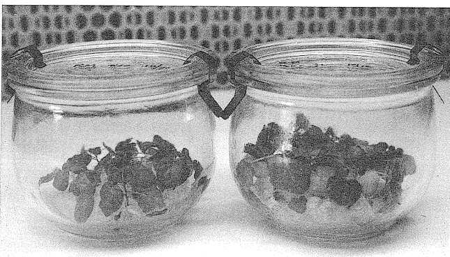
Der ökologische Landbau vermeidet risikobehaftete Technologien. Im Bild: In vitro wachsende transgene Kartoffelpflanzen.

Die Dynamik technischer Fortschritte wirft die Frage auf, wie mit Risiken bei der Nutzung neuer Technologien umzugehen ist, die möglicherweise am Beginn ihres Einsatzes noch nicht erkennbar sind. Ein Weg kann sein, bewährte, über lange Zeiträume nicht mit schwer wiegenden Risiken behaftete Technologien in hinreichendem Umfang beizubehalten, auf die dann beim Auftreten plötzlicher unerkannter Risiken umgeschwenkt werden kann.