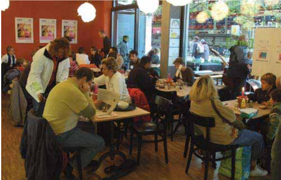
Solidaritätswelle: Nach den Pressemeldungen über die wirtschaftlichen Schwierigkeiten des Rägeboge zogen die Umsätze spürbar an. Auch am 1. Geburtstag des Winterthurer Biosupermarktes am 11. November (Bilder) waren Laden und Bistro sehr gut besucht.

nommen hat, verweist auf die massive Konkurrenz durch Migros und Coop. Entsprechend müsse man in der Beratung besonders stark sein und beispielsweise Allergiker auf das für sie verträgliche Sortiment aufmerksam machen. «Es ist erstaunlich, wie lange die Kundschaft im Laden verweilt, bei Degustationen mitmacht und die Packungsaufschriften liest», so die Erfahrung Mentis. Entsprechend lasse sich Mehrumsatz generieren, wenn Personal präsent sei und aktiv auf neue oder ergänzende Produkte hinweise. Zurückfahren will Menti hin-