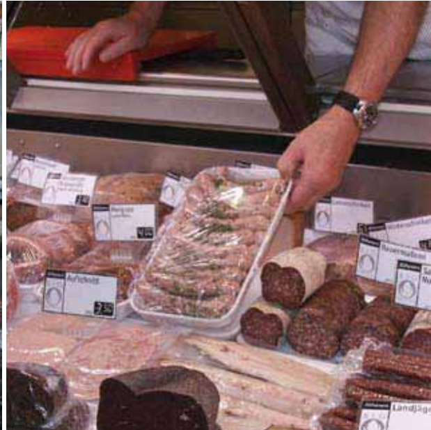
Brot, Käse, Fleisch und Wurst gibt's bei Höheners in Basel an bedienten Theken. Vatter in Bern und der Rägeboge in Winterthur wollen den Aufwand mit einem höheren Anteil an Selbstbedienung dämpfen, die Beratungskompetenz aber bewahren.