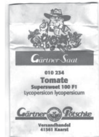
Hybridsorten sind auch im Öko-Gartenbau weit verbreitet

Veröffentlichungen zur Qualität von Hybridsorten im ökologischen/biologisch-dynamischen Landbau liegen über Möhren, Kohl und Roggen vor. Es kann davon ausgegangen werden, dass Züchter mit weiteren Kulturen Erfahrungen über das Thema gemacht haben. Die Ergebnisse über die Jahre und Kulturen sind weitgehend konsistent: Die Inhaltsstoffe zeigen keine sichere qualitative Differenzierung von Hybriden und Populationssorten. In der Sensorik gibt es Hinweise auf eine unterschiedliche Bewertung von Hybriden und Populationssorten je nach Methodik. In dem einen bekannten Futterwahlversuch wurde die Populationssorte klar bevorzugt. In der einen veröffentlichten Bio-Lumineszenz -Untersuchung wurden Hybridroggen-sorten als wachstums- statt reifeorientiert beschrieben. Die bildschaffenden Methoden zeigen deutliche Qualitätsverluste bei Hybridsorten. Sie werden im Vergleich zu Populationssorten je nach Sorte entweder als weniger reif und unharmonisch, als gering belebt und stressanfällig oder als kräftig und zugleich starr/unbeweglich charakterisiert. Dorian Schmidt charakterisiert die Bildekräftewirkung von Hybridsorten (mittels der Me-