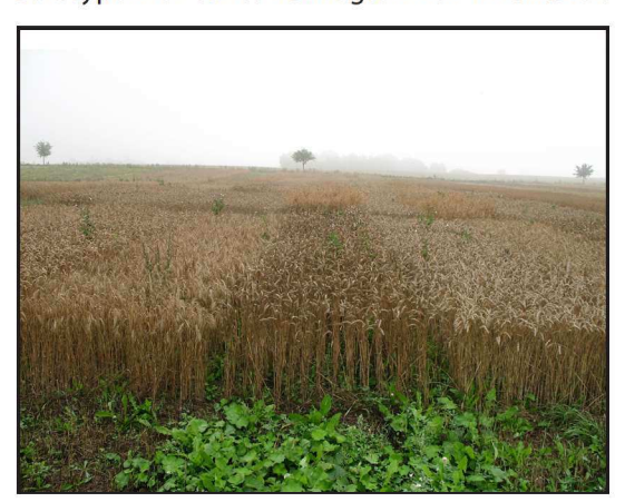
Billede 1. Vintersæd artsforsøg 2007.

Sorterne der er anvendt fremgår af tabel 1. Jordtypen er JB 6. Forfrugten var hvidkløver.