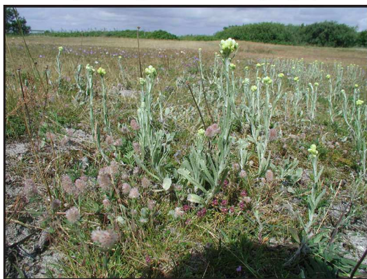
Billede 1. Strandarealet ved Vig Lyng i 1995: Roser og pilekrat breder sig ind over den sarte tørbundsvegetation og ud i den våde strandeng.

Det var først og fremmest ønsket om en genetablering af udsigten, som satte gang i proces-