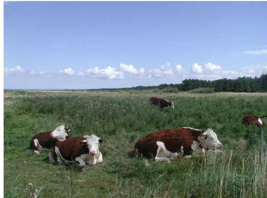
Billede 5. Skarntyder, agertidsler, tagrør og hybenroser er efter tre græsningssæsoner minimeret eller helt væk til fordel for mere næringsrigt græs

vegetation grundejerforeningens medlemmer ryddede på de årlige arbejdsdage. Herudover har grundejerforeningen fået tilskud fra Fri-luftsrådets Tips- og lottomidler og fra den lokale Nordeafond.