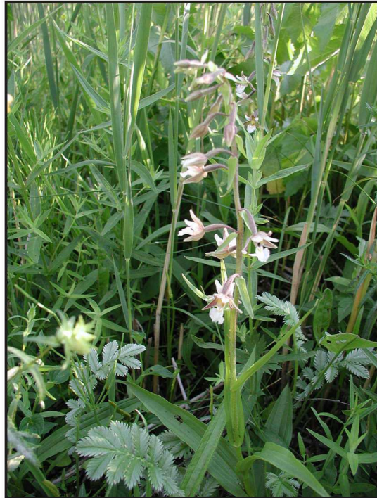
Billede 7. I løbet af få år forventes det, at orkideer som sump-hullæbe og maj-gøgeurt eller plettet gøgeurt vil spire frem på den afgræssede strandeng.