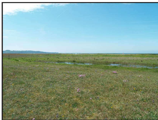
Billede 2. Strandareal ved Vig Lyng maj 2007 efter manuel rydning af skovfyr, birk, gråpil og især hybenrosen rynket rose ( Rosa rugosa ) og fem års afgræsning med Hereford kvæg.

Såvel det daværende Vestsjællands Amt som den daværende Trundholm kommune har bistået grundejerforeningen med henholdsvis midler til naturpleje og med bortkørsel af den