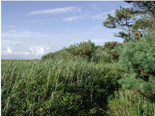
Billede 3. Tilgroningen ved Vig Lyng før plejeindsatsen. Pil, fyr og roser blev skåret ned og bortkørt. Ligeledes blev tagrør høstet og bortkørt. Rosegenvækst blev påsmurt Roundup.