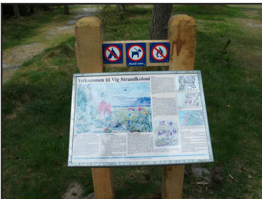
Billede 4. Ikke alle er lige begejstrede for tanken om husdyr så tæt på fritidshusene. Derfor dette skilt med information om plejeprojektet.

Modsat har der fra husdyrholderens side været et krav om, at dyrene har adgang til frisk drikkevand. Det har derfor været nødvendigt at fremføre vandværksvand til foldene. Selvom arealet kun er på knap to hektar, er det opdelt i to folde, således at dyrene kan holdes på arealet i hele græsningsperioden. Hermed er det også muligt at styre græsningstrykket, såfremt der igen skulle fremspire problemarter eller modsat være særlige naturhensyn at tage i forhold til orkideer eller ynglende fugle.