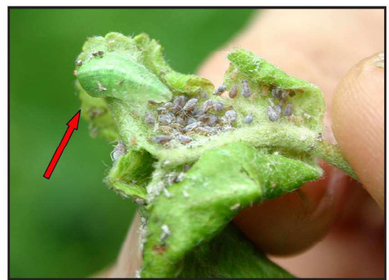
Billede 2. Svirrefluelarve i røde æblebladlus. Svirrefluelarven er med sin grønne farve utroligt godt camufleret. Kan du se den øverst til venstre på bladet?

Skal urtestriben bruges som kant omkring flerårige kulturer, f.eks. i frugt- og bærplantager kan man vælge samme blanding som