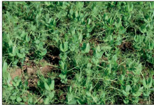
Billede 1. Markært er en åben afgrøde indtil den lukker af.

Resultaterne af forsøgene kan ses i tabel 1. I gennemsnit af de fire forsøg var der før høst ikke nogen klar forskel i ukrudtsdækning med og uden vårhvede. Til gengæld ses en tendens til at ukrudtstrykket er lavest ved den høje udsædmængde i ærterne.