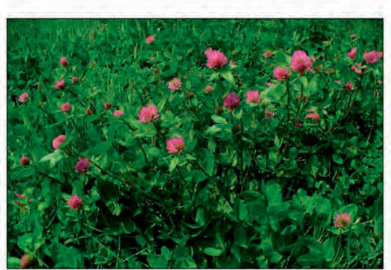
Billede 2. Rødkløver har et højere udbyttepotentiale og dermed også potentiale for bedre økonomi.

lige at tegne kontrakter på. Lad dig dog ikke skræmme af dette, hvis du mener at kunne løfte en opgave med at dyrke f.eks. 1 ha purløg eller timian til frø eller 5 ha karse. Der sker hele tiden mindre udskiftning af avlere og så er det jo en fordel at stå på ventelisten, hvis der skulle blive mulighed for at få dyrkningen af en spændende afgrøde. I det følgende vil jeg derfor kun beskæftige mig med de tre mest dyrkede økologiske frøafgrøder – alm. rajgræs, hvidkløver og rødkløver - se figur 1.