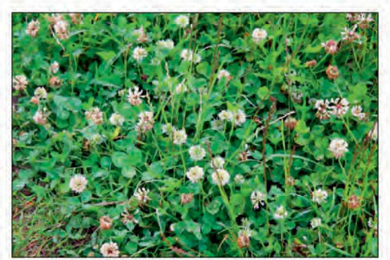
Billede 1. Hvidkløver til fremavl er kritisk i forhold til varme ved blomstring og tørt vejr omkring høst.