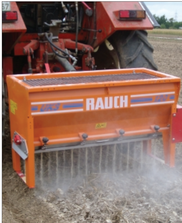
Abb. 2. Der Kastendüngerstreuer UKS von Rauch ist gut für die Ausbringung mehl- und pulverförmiger Dünger geeignet.

Organische Handelsdünger sind gegenüber mineralischen Düngern schwieriger auszubringen. Pellets und gekrümelte Dünger (Granu-