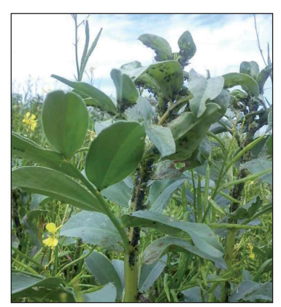
Billede 1. Der blev i 2012 konstateret luseangreb i flere marker med hestebønne. Især Østdanmark var hårdt ramt.

Højeste udbytter er målt i Fuego og Isabel, som tilsyneladende også har haft en lidt lavere angrebsgrad af chokoladeplet. Columbo har indtil videre været den eneste tanninfrie sort, der har været til rådighed for økologer i Danmark, men udbyttet er efterhånden uacceptabelt lavt. Vi må håbe at såsædsfirmaerne ser sig om efter mere højtydende hvidblomstrende sorter til økologerne. Ud fra de svenske forsøg ser sorterne Alexia og Julia begge interessante ud. Alexia skulle komme på markedet som økologisk udsæd i 2013.