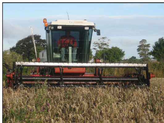
Billede 1. Skårlægning af triticale.