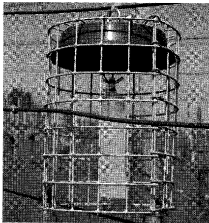
La pièce centrale d'un collecteur passif est un cylindre de verre corrodé sur lequel les pesticides se déposent.

La dérive des traitements des parcelles non bio est souvent invoquée comme responsable de la contamination des vins bio. On trouve dans la littérature que 20 à 30 % de deux pesticides courants, le Cyprodinil et le Fludioxonil, passent du raisin dans le vin, alors qu'un autre fongicide courant, le Folpet, est quasi complètement dégradé. Malgré cela, les méthodes d'analyses utilisées pour trouver du Cyprodinil et du Fludioxonil dans le raisin ne sont pas assez sensibles pour pouvoir en conclure qu'il y aura forcément des résidus dans les vins. C'est ainsi en effet qu'on a pu trouver ces