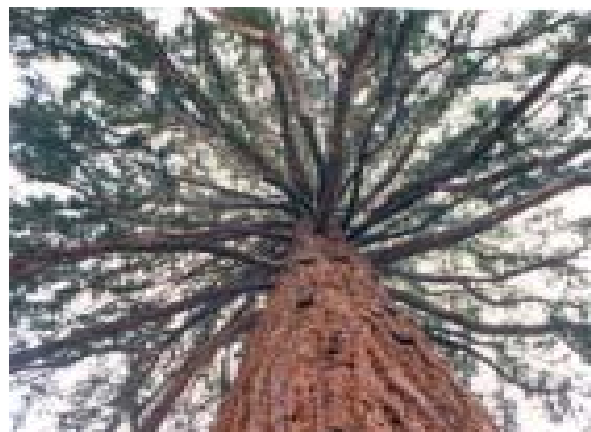
...birgt manche Überraschung.

Allerdings, es kann durchaus sein, dass es nötig ist, auf eine Form der