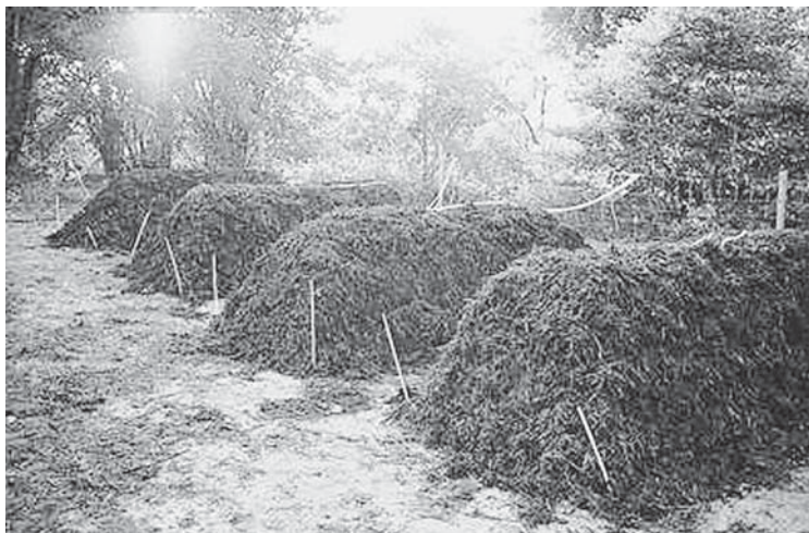
Kompost, biodynamisch präpariert, baut den Boden auf.

Tab. 4: Einfluß der Düngung und Anwendung der biologisch-dynamischen Präparate auf die Dehydrogenaseaktivität (DEH) des Bodens in den Langzeitversuchen in Therwil (Schweiz), Darmstadt (Deutschland) und Järna (Schweden); Ergebnisse jeweils relativ zu Mineraldüngung = 100%; Zusammenstellung von Mäder et al. (1996), Datenquellen s. d.