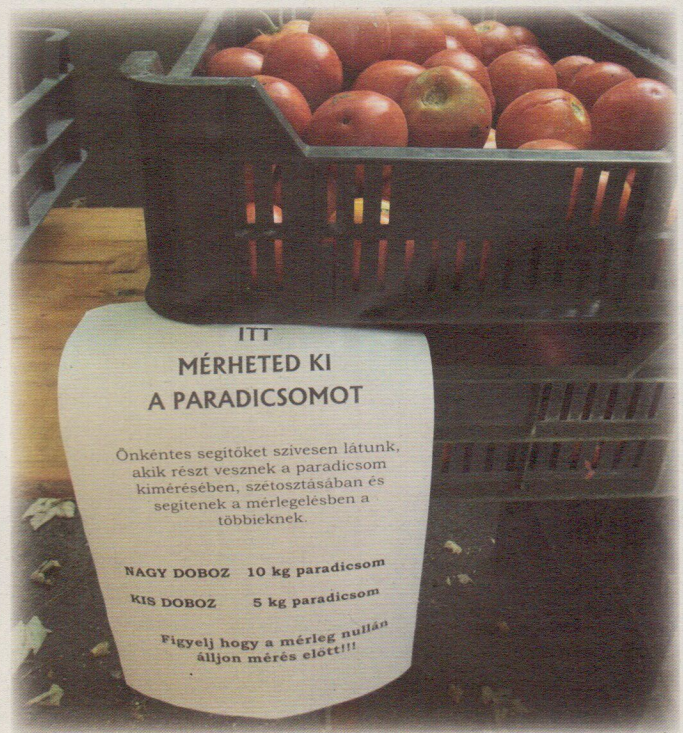
Paradicsomosztás önkéntes segítséggel az átvévponton

A francia AMAP mozgalmat azért is érdemes megemlíteni, mert 2001-es megalakulását követően egy Chartában foglalta össze minden tagja által osztott alapelveit, amelyeket a világ különböző pontjain működő termelői-fogyasztói közösségek közül sokak – például egyes magyar közösségi gazdaságok is – átvettek és alkalmaznak.