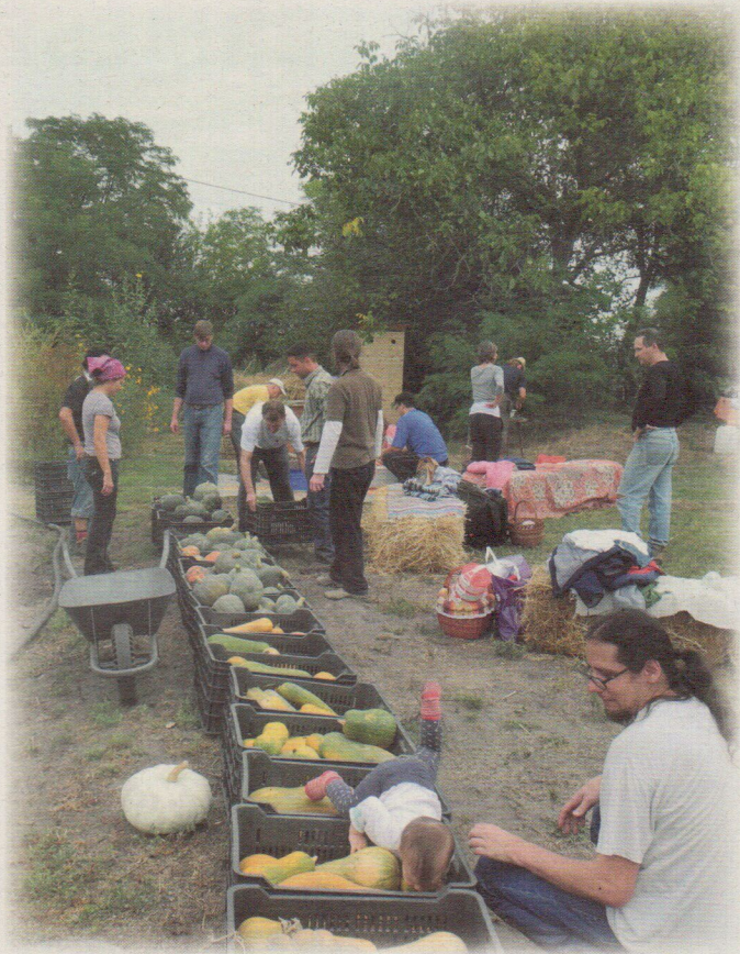
Betakartási „ünnep” a zöldségközösség tagjaival a biogazdaságban