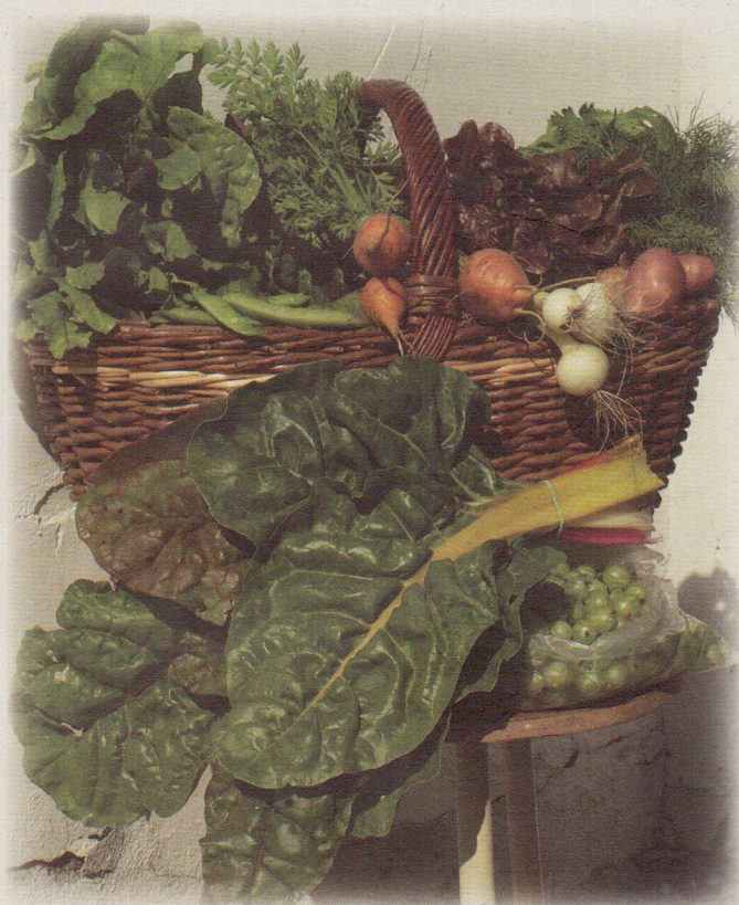
Júniusi zöldségkompozíció az Évkerék Ökotanyán