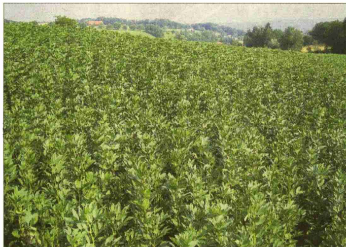
Ackerbohnen haben einen sehr guten Vorfruchtwert und lassen sich auch pfluglos anbauen.

Themen-Nr.: 541.3 Abo-Nr.: 1008268 Seite: 29 Fläche: 25'149 mm 2