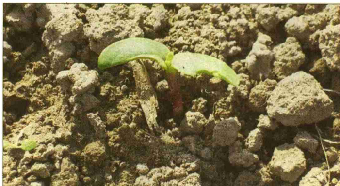
Besonders die Sonnenblumenkeimlinge sind dieses Jahr von Schneckenfrass betroffen.