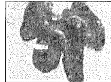
Lever med ormepletter forårsaget af spolormen.

I bananplantager bruges mikrosvampe til at nedbryde æg af planteparasitiske orme. PAROL har derfor undersøgt, om svampene også kunne bruges til at odelægge spolormens æg i jorden. Svampene danner enzymer, der kan nedbryde ki-